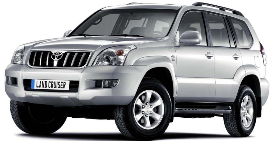
Защита, КПП, РКПП 1.0610.00 Toyota Landcruiser Prado 120