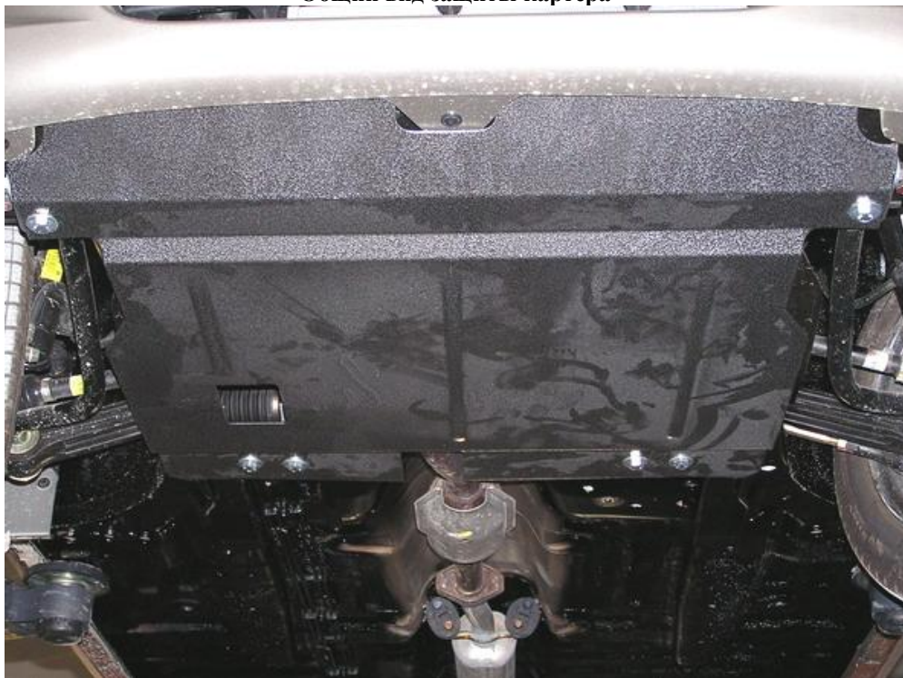
Общий вид защиты картера